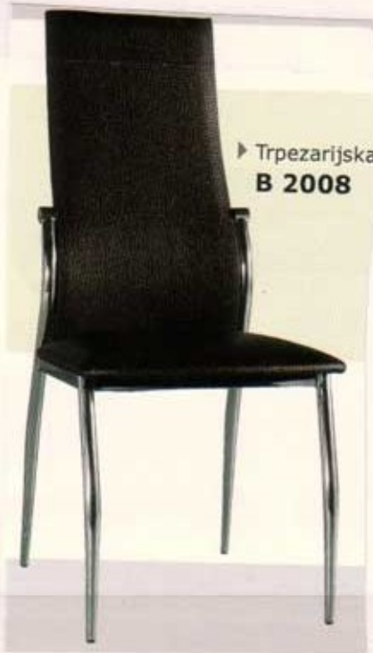
► Trpezarijska B 2008