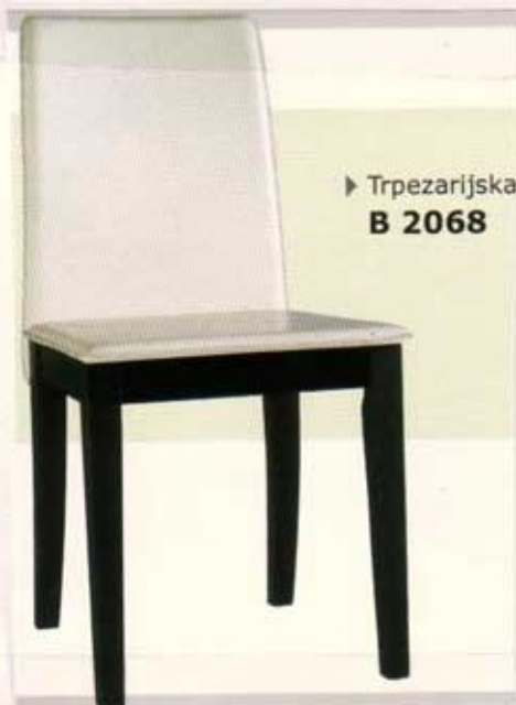
► Trpezarijska B 2068