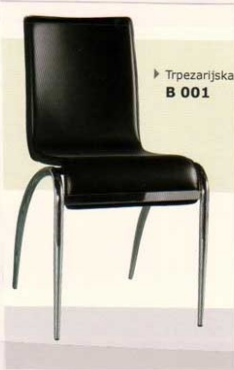
▶ Trpezarijska B 001